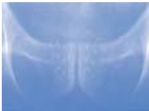
Röntgenbild nach Seedimplantation

Aus diesem Grund ist die permanente LDR-Brachytherapie gemäß allen nationalen und internationalen Leitlinien neben der Radikaloperation und der externen Bestrahlung eine empfohlene Therapieoption bei diesem Krebsleiden.